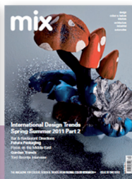
mix 20 S/S 2011