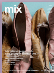
mix 23 S/S 2012