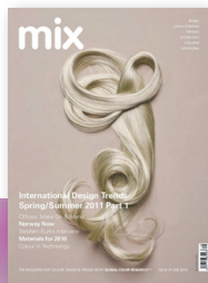
mix 19 S/S 2011