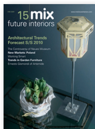
mix 15 S/S 2010