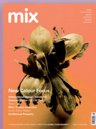
mix 22 A/W 2011/12