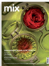
mix 18 A/W 2010/11