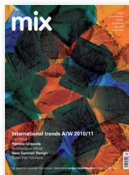
mix 17 A/W 2010/11