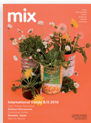
mix 16 S/S 2010