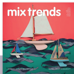
mix trendbook A/W 2012/13