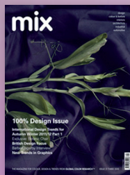
mix 21 A/W 2011/12